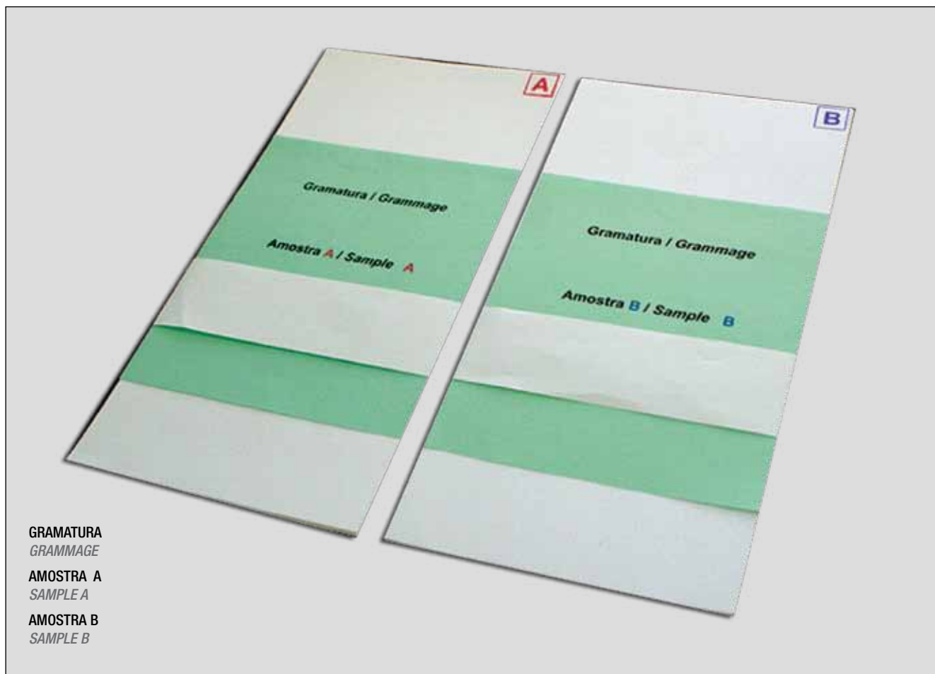
Figura 1. Par de amostras enviado a cada participante por rodada / Figure 1. Pair of samples sent to each participant per round

In each round the participant laboratory received two test items called Sample A and Sample B, respectively, each of them consisting of 10 sheets of paper measuring 14cm x 28cm. Figure 1 presents a photo of a pair of samples sent.