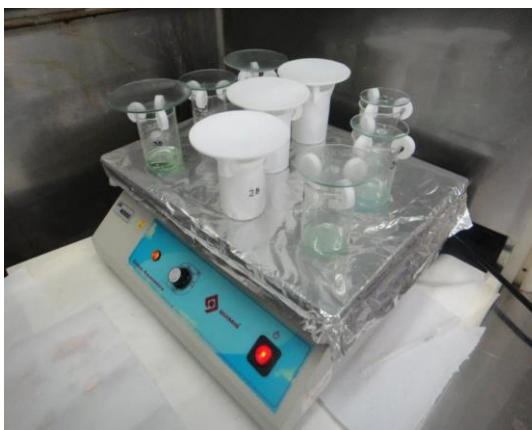
Figura 2: Preparação das amostras.

A figura 2 a seguir ilustra uma das etapas para a abertura das amostras.