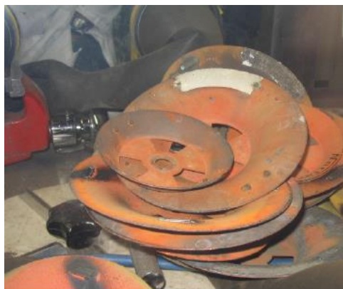
Figura 1: Disco de para-raios

Um dos subprodutos de descontaminação dos para-raios após o desmantelamento é a resina que foi utilizada na pintura dos discos de para-raios e que eventualmente encontram-se contaminadas com o radionuclídeo.