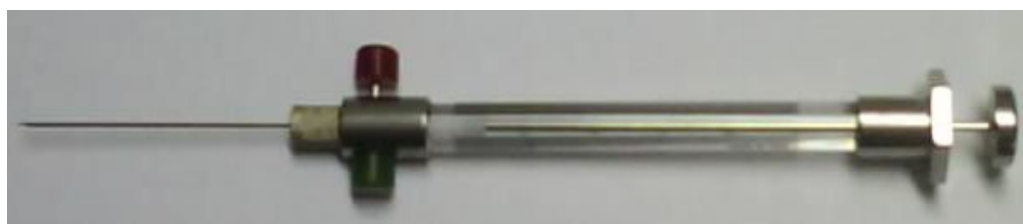
Fig.3: Seringa cromatográfica gastight para retirada de amostras de gases da decomposição dos pesticidas.