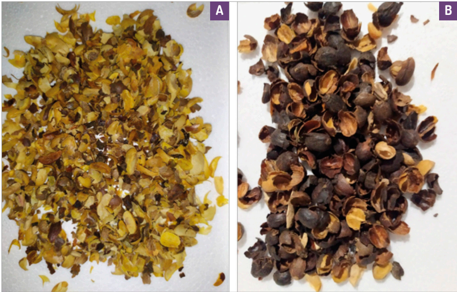
Figura 25: Resíduos agroindústrias do café: palha (A) e casca (B).

mais estudos específicos para melhor e compreender esses efeitos, além de otimizar o uso da irradiação para preservar e melhorar a qualidade nutricional dos alimentos.