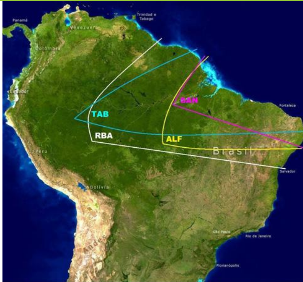
Figura 1. Imagem do Brasil destacando a área de representatividade de cada um dos quatro locais de estudo, ALF, RBA, SAN e TAB.