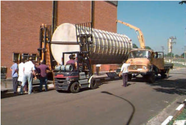
Figura 2. Liner da Piscina de Armazenamento de Fontes Radioativas do Irradiador Multipropósito de Cobalto-60 tipo Compacto.