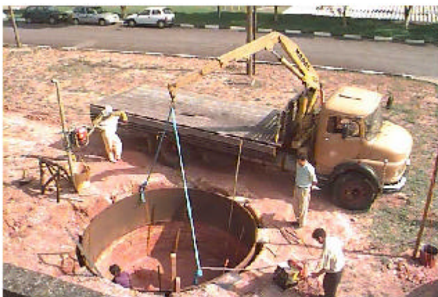
Figura 3. Escavação da Piscina do Irradiador Multipropósito de Cobalto-60 tipo Compacto.

No Irradiador Multipropósito, os produtos a serem processados, em sua embalagem final, serão colocados em caixas no sistema de transporte, na área de armazenamento de produtos não irradiados. A seguir, as caixas serão transportadas automaticamente por um sistema hidráulico até o interior da sala de irradiação. O sistema promoverá a passagem das caixas com os produtos ao redor dos 2 (dois) racks de fontes de Cobalto-60, em um tempo previamente determinado, de acordo com a dose de radiação estabelecida no processamento do produto. Após a irradiação ter sido completada, as caixas serão transportadas pelo sistema hidráulico até a área de produtos processados, onde os mesmos serão descarregados das caixas. A quantidade de racks de fontes a serem retirados para fora da piscina de armazenamento, dependerá das doses e taxas de dose requeridas pelos produtos e/ou matérias-primas a serem processados.