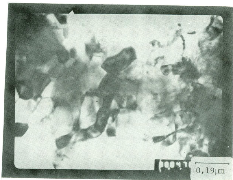
Figura 3 - Micrografia para Amostra com Tratamen to Térmico em 640°C/100h.