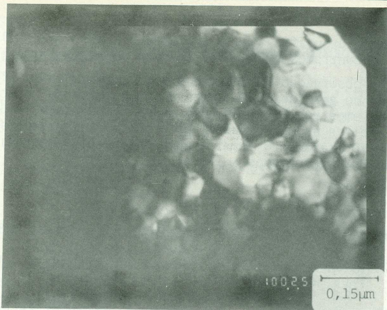
Figura 1 - Micrografia para Amostra com Tratamento Térmico em 640°C/50h.