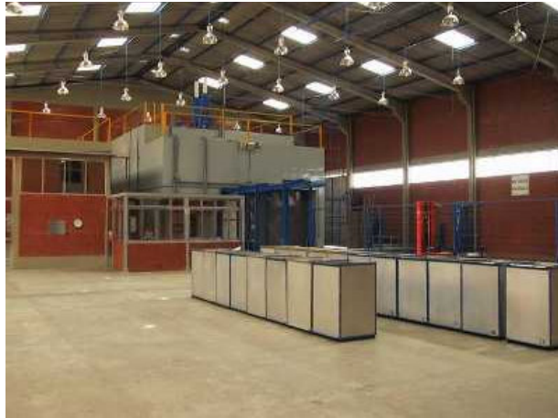
Figura 3. Irradiador Multipropósito de Cobalto-60 tipo Compacto, projetado, construído e implantado no IPEN, com tecnologia nacional e apoio financeiro da FAPESP.