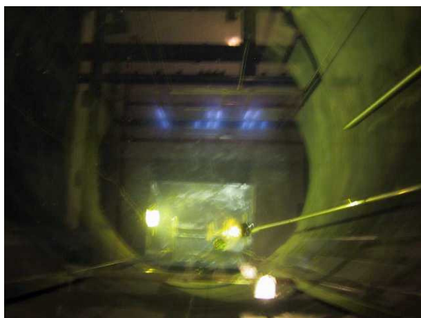
Figura 4. Fontes seladas de ^{60}\text{Co} instaladas nos 6 magazines dos 2 racks do Irradiador Multipropósito, no total de 3.407,7TBq (92.099Ci, em 26/11/04).